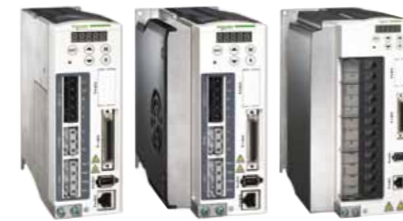
Lexium 23 D I/O 驅動器