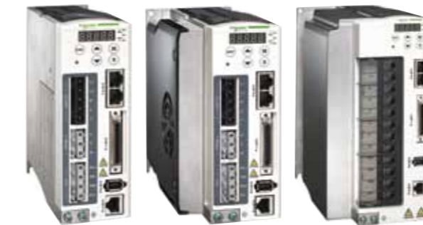
Lexium 23 A CANopen 驅動器